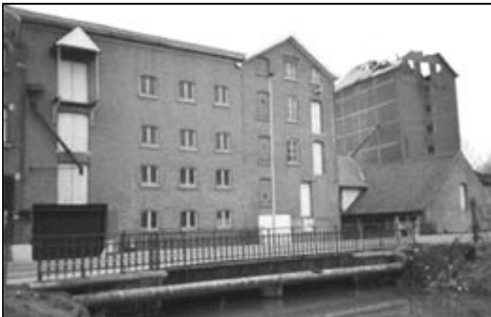
Mertensmolen te Viane.

Praktische informatie : de Mertensmolen is gelegen Edingseweg 401 te Viane. Bezoek na afspraak via telefoon 0475/36.70.62 of via herman.merckaert@telenet.be (Vrij naar Molenecho's, 2006, nr. 4, met dank aan de redactie van Molenecho's)