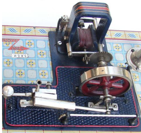
stoommotor en dynamo