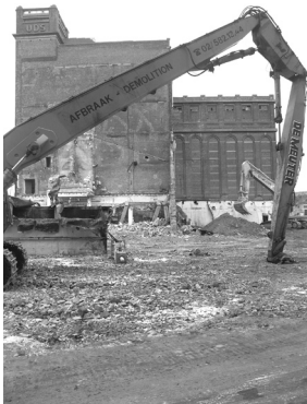
De stordeur tijdens de sloop. Foto: Andre Cresens - voorjaar 2005