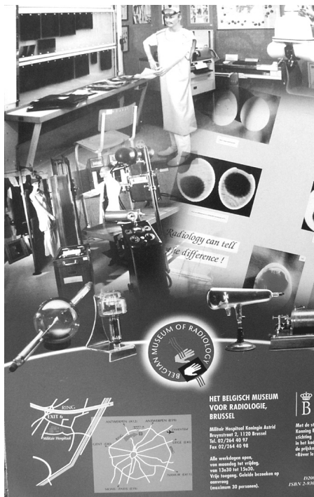
Een publicatie van het Belgisch Museum voor Radiologie

Enige tijd terug kreeg SIWE vzw een vraag tot advies vanuit het Museum Dr. Guislain ( http://www.museumdrguislain.be ) met betrekking tot de collecties van het Belgisch Museum voor Radiologie . Dit radiologisch museum is vrij uniek qua onderwerp (andere gelijkaardige musea bevinden zich in West-Europa in Italië (Palermo) en Duitsland (Würzburg en Remscheid-Lennep) en werd in 1990