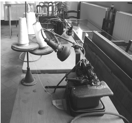
Uit een voormalig naaiatelier uit (Groot-)Zemst

De vuurmolen werd tot in 1955 aangedreven door stoom. Die werd opgewekt door verbranding van steenkool die werd aangevoerd via de oude stoomtram Overijse-Groenendaal. In de vuurmolen werd graan gemalen tot bloem. Onze vuurmolen werd in 1902 gebouwd