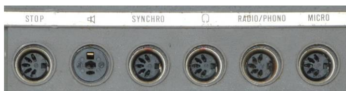
aansluitingen zijkant links