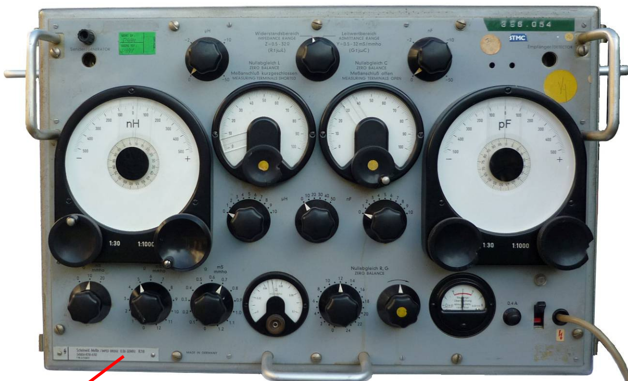
Scheinwid.-Meßbr./IMPED BRIDGE 0.06-30MHz R218 S45034-R218-A702 F-Nr. 6/510833