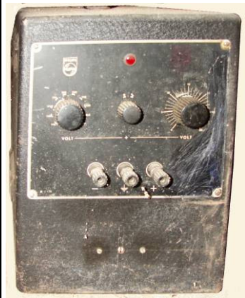
508.38 Philips voeding?