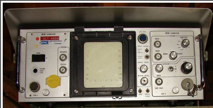
508.44 ThermoVision AGA van BTMC