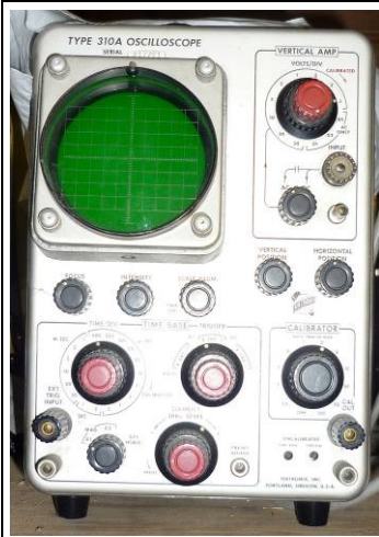
508.9 Oscilloscope Tektronix 310A