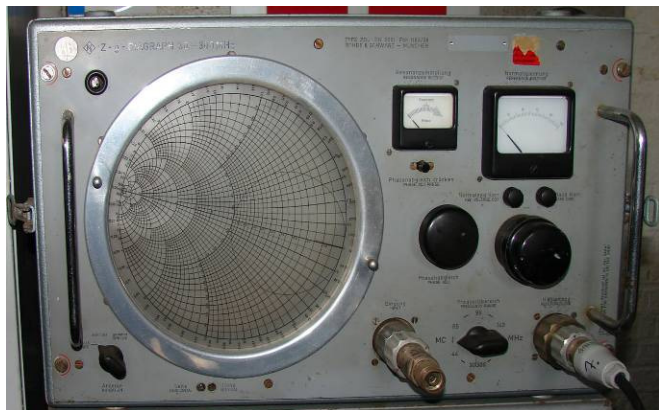
508.26 Rohde & Schwarz Z-G-Diagraph type ZDU BN3561 30-300MHz