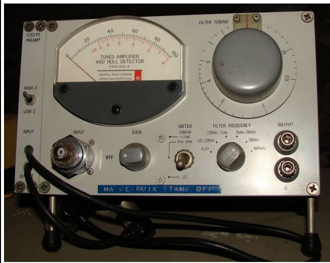
508.37 Turned amplifier and null detector