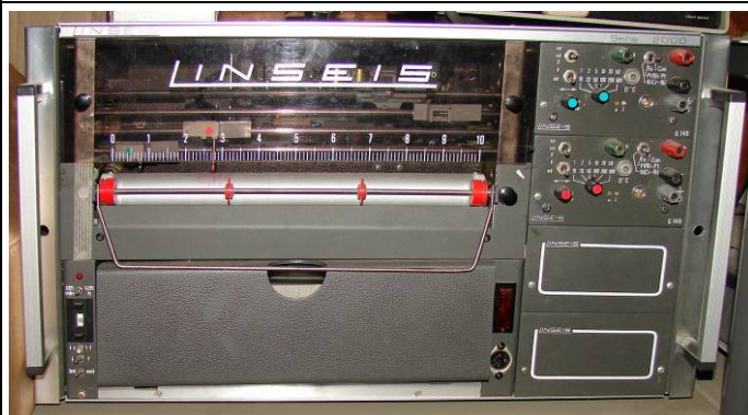
508.48 Tweekanaals?schrijver Linseis