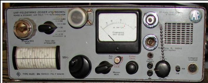
508.33 R.&S. UHF-Feldstärke-Zeiger 470-850MHz