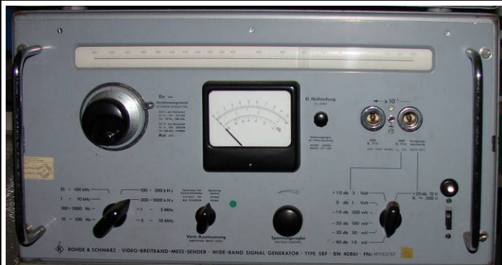
50836 R.&S. Video Breitband Messsender Type SBF BN40861