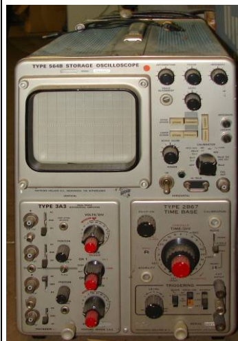
508.12 Oscilloscope Tektronix Type 564B0