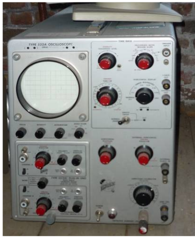
508.13 Oscilloscope Tektronix Type 588A