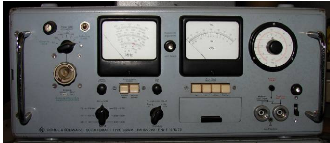
508.30 Rohde & Schwarz Selektomat Type USWV BN15221/2