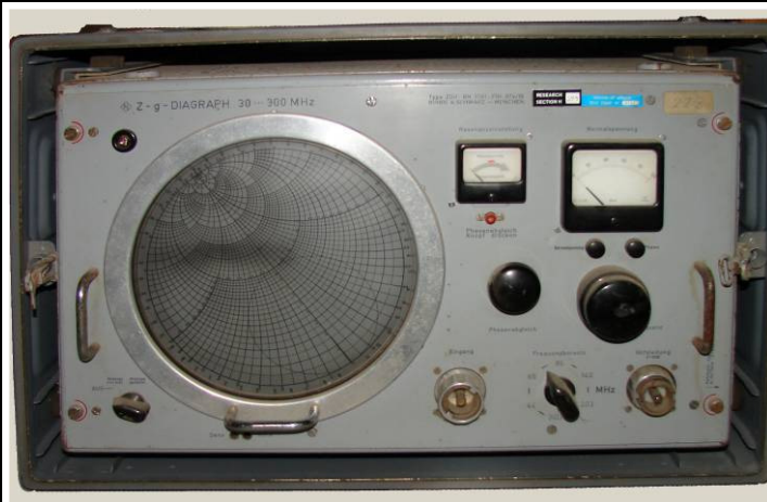
508.49 Rohde & Schwarz Z-G-Diagraph type ZDU BN3561 30-300MHz (= 508.26)