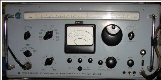
50835 R.&S. Selektives Mikrovoltmeter 10k-30MHz Type USVH BN1521/2