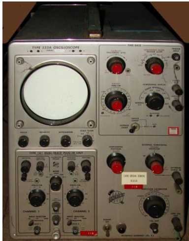
508.14 Tektronis 533A