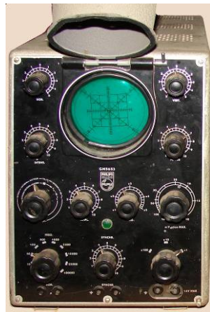
508.6 Oscilloscope Philips GM5653