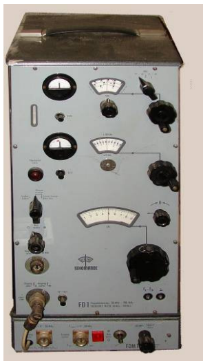
508.23 Schomandl Frequenzmesser type FD1 30Mhz - 900MHz