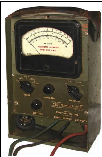
508.41 Volt- Ohmmeter I-107-C Espey MFG New York