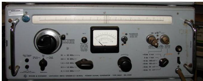
508.31 R. & S. Leistungsmesssender 0,1 - 30MHz Type USWV BN15221/2