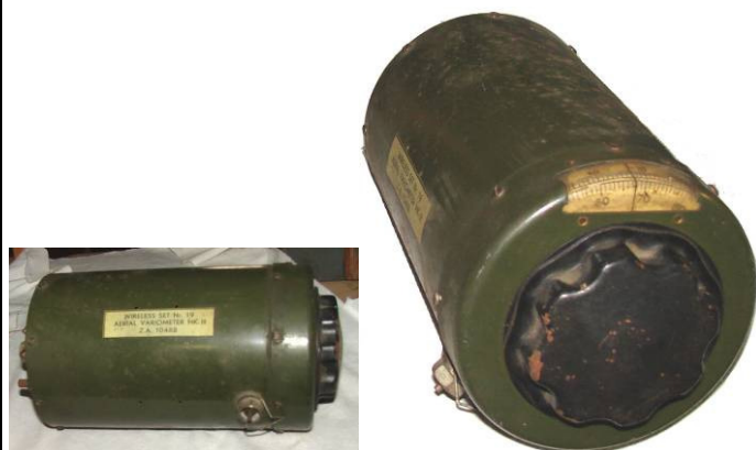
508.40 Aerial variometer Mic III Wireless net 19 Z.A.10488