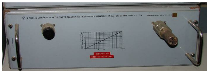
508.28 Rohde & Schwarz Präzisionsvorlaufkabel type BN3568151