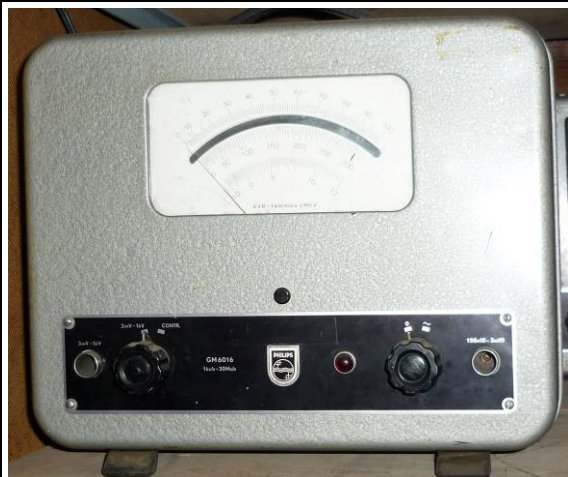
508.2 Elektronische voltmeter Philips GM 6016 gift van dhr Nap van Zuuren