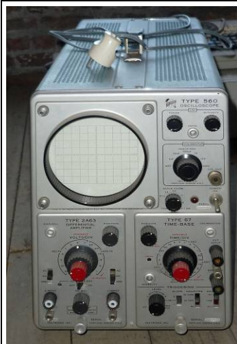
508.11 Oscilloscope Tektronix Type 560