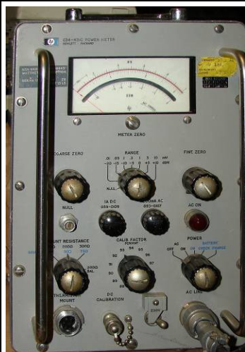
508.4 HP Wattmeter Powermeter C34-431C