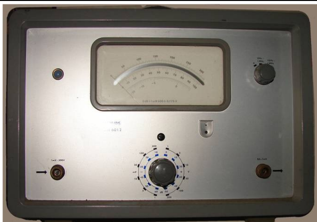
508.24 Philips AC-millivoltmeter GM6012