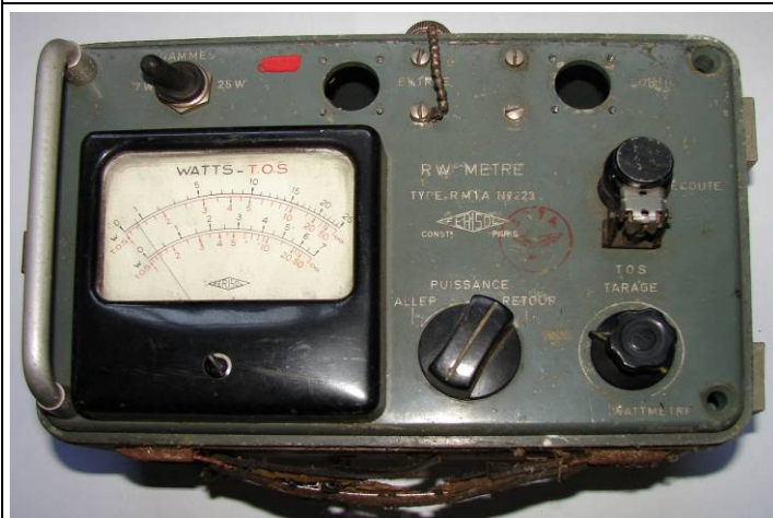
508.43 R.W.-meter Ferisol Type RMTA nr.223