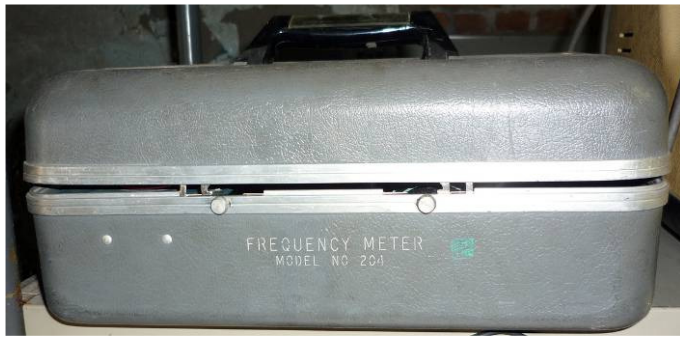
v8.21 Hoogfrequentmeter Model 204