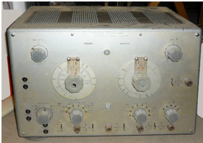
508.22 Philips GM2314 meetzender?