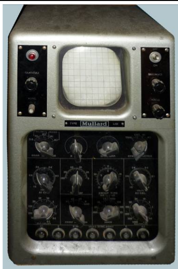
508.15 Oscilloscope Mullard L101