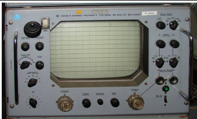
508.27 Rohde & Schwarz Polyskop II type ZDU BN4245