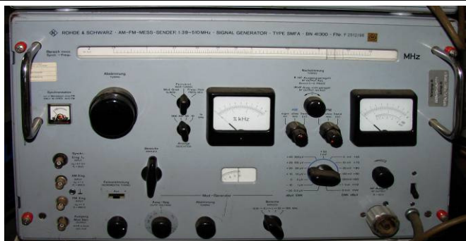
508.32 R. & S. AM-FM-Messsender 1,39-30MHz