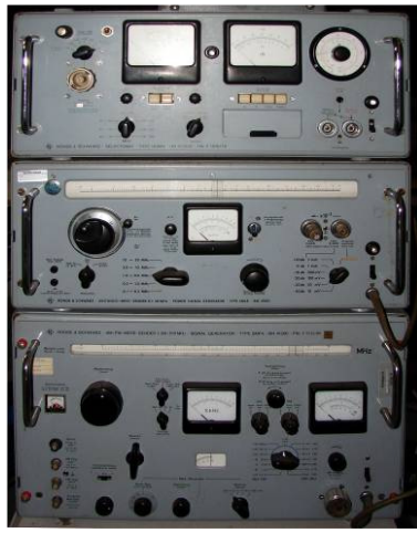
508.29 Drie apparaten Rohde & Schwarz