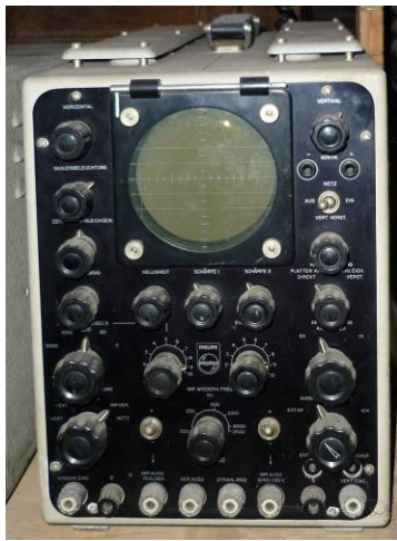
508.5 Oscilloscope Philips GM5660