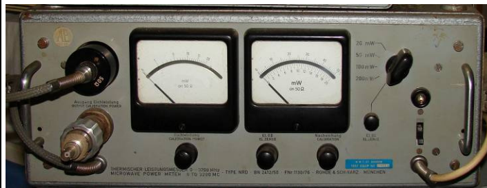
508.34 R.&S. Thermischer Leistungsmesser 0...3200MHz. Type NRD BN2412/50