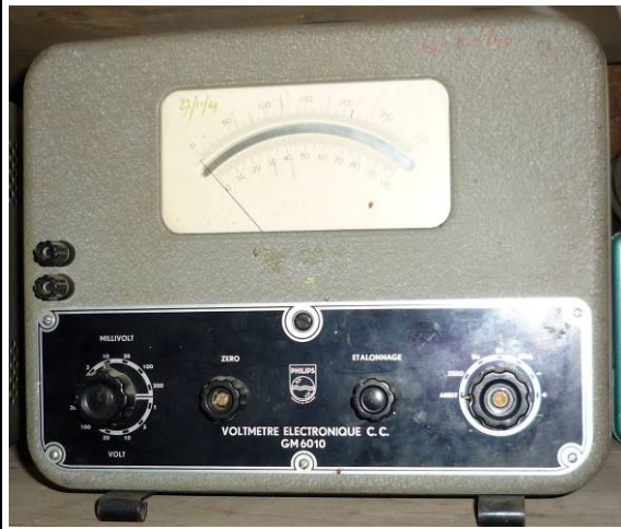
508.1 Elektronische voltmeter Philips GM 6010 gift van dhr Nap van Zuuren