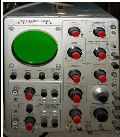
508.10 Oscilloscope Tektronix Type 545A