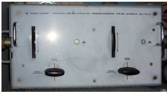
508.25.. R&S. Eichleitung 0-3000MHz 0-109 DB 50Ω Standard attenuator Type DPU BN18044/50