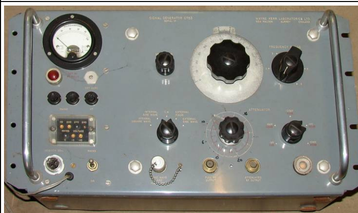
508.51 Signal generator Wayne CT53 Kerr Laboratories LTD England