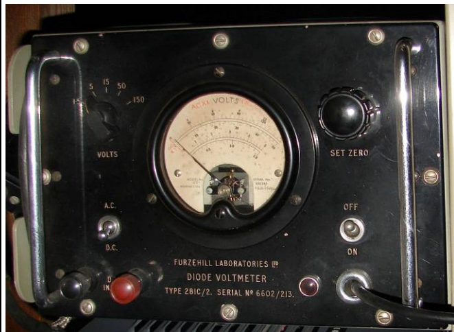
508.46 Diode Voltmeter typt 281C/2 Furzehill Laboratories