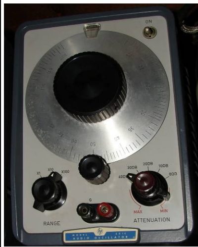
508.45 H.P. Audio Oscillator 201C