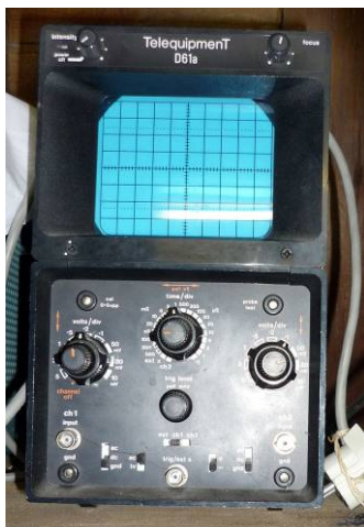
508.16 Oscilloscope Telequipment D61A