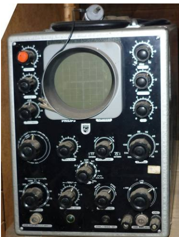
508.7 Oscilloscope Philips GM5662