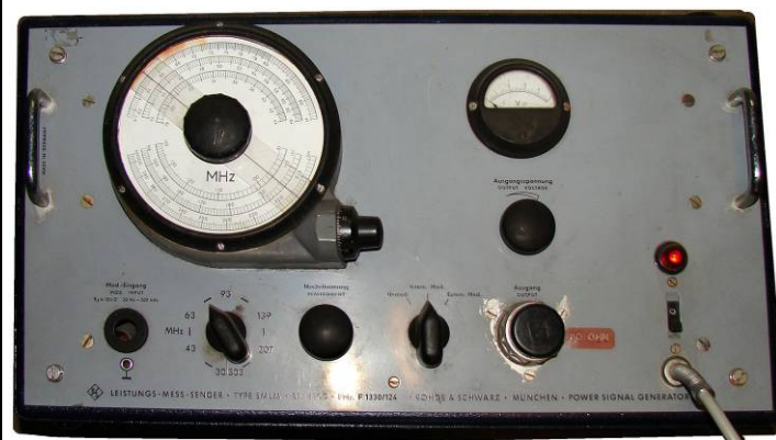
508.50 Rohde & Schwarz Leistungs Mess Sender Type . BN4105